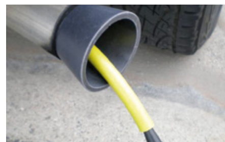
Il localizzatore di perdite può rilevare perdite anche all'interno degli impianti di scarico