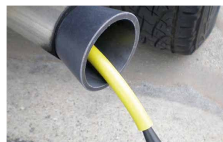
Leakfinder kann auch Undichtigkeiten im Auspuff-System finden