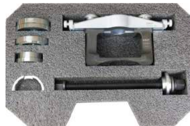
VKN 600: facile e rapido montaggio dei cuscinetti HBU 2.1 senza rimozione dello snodo dall'auto.