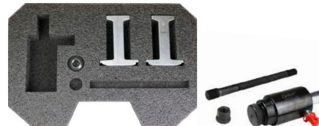
VKN 601: Attrezzo di smontaggio HBU 2.1. Nella scatola è previsto un posto per completare il kit con il cilindro idraulico opzionale VKN 602-1.